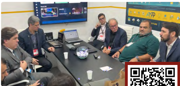
Ministro das Comunicações, Frederico de Siqueira Filho se reúne com delegação brasileira para debater os próximos passos da TV 3.0. Reveja a entrevista