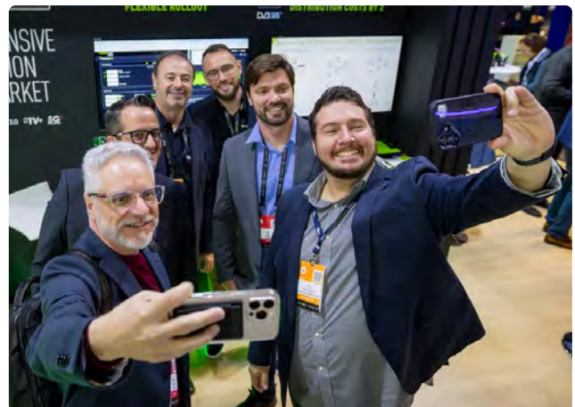
Brasileiros posam para selfie no IBC 2025.