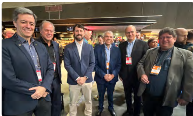
Delegação Brasileira em Amsterdã.