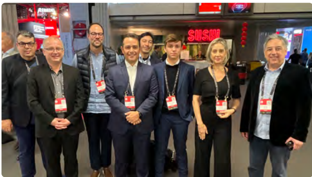
Delegação Brasileira em Amsterdã.