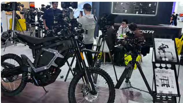
Tilta apresentou diversas novidades no IBC 2025, entre elas, o Tilta Boulder, um novo carrinho para câmeras, projetado para oferecer um espaço de trabalho robusto e portátil. Sua construção altamente modular e a variedade de acessórios disponíveis permitem adaptá-lo a qualquer cenário em um set de captação.