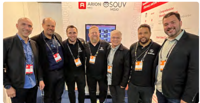
Equipe da Convergent junto a TV Integração e SNews no estande da última no IBC 2025