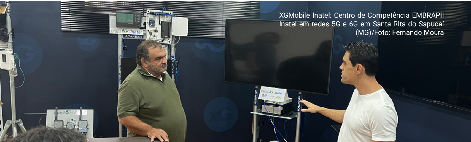
XGMobile Inatel: Centro de Competência EMBRAPPI Inatel em redes 5G e 6G em Santa Rita do Sapucaí (MG)