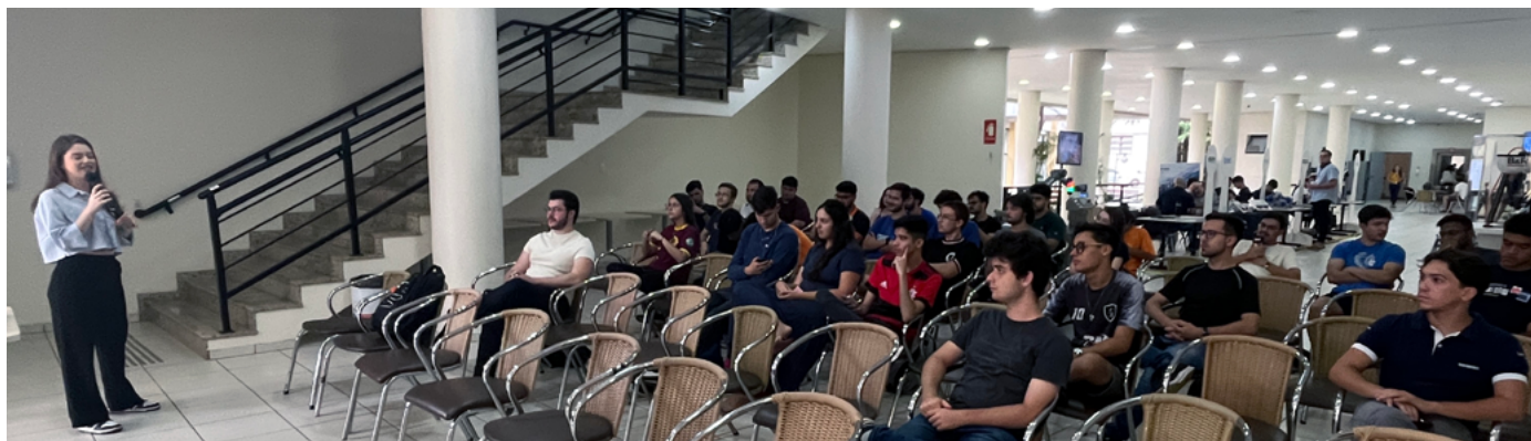
Aula no Inatel em Santa Rita do Sapucaí, Minas Gerais

Diante de tudo isso, fica evidente que estamos diante de uma nova ameaça de extinção – não de animais, mas de competências. Quando deixamos de formar engenheiros especializados, perdemos o domínio (ou a participação) sobre os sistemas que mantêm o mundo funcionando. É um processo silencioso, disfarçado pela conveniência das soluções prontas e pela falsa sensação de que tudo continuará operando de forma perene e perpétua sem que sejam necessárias grandes intervenções. Sistemas complexos são carentes de atenção humana. Se não reconstruirmos o ecossistema que forma, valoriza e retém profissionais capazes de projetar o futuro, seremos apenas usuários – e não autores – da próxima revolução tecnológica. E se isso ainda parece exagero, convido você a imaginar o que seria de nós se, de repente, os Estados Unidos resolvessem simplesmente puxar da tomada o sistema de GPS.