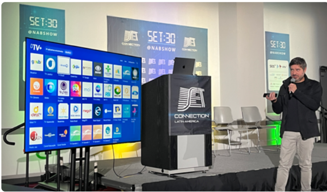
Leandro Gejfinbein apresentou o novo ecossistema do DTV+ e as suas principais funcionalidades