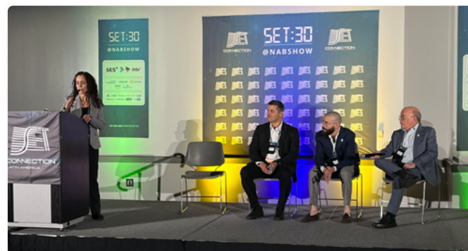
Ana Eliza afirmou que a DTV+ é o começo de uma nova era da televisão

Por fim, Wellisch adiantou que o governo federal busca apoio financeiro para garantir a transição tecnológica. “Conversamos com o BID e o Banco Mundial para viabilizar linhas de crédito que ajudem as emissoras a investir nesse novo ciclo.” E completou com um convite: “O Brasil está de portas abertas para quem quiser conhecer a nova tecnologia. Estamos prontos para dialogar com os países da América Latina.” A expectativa é que a norma do DTV+ e seu decreto regulatório estejam finalizados até meados de 2025.