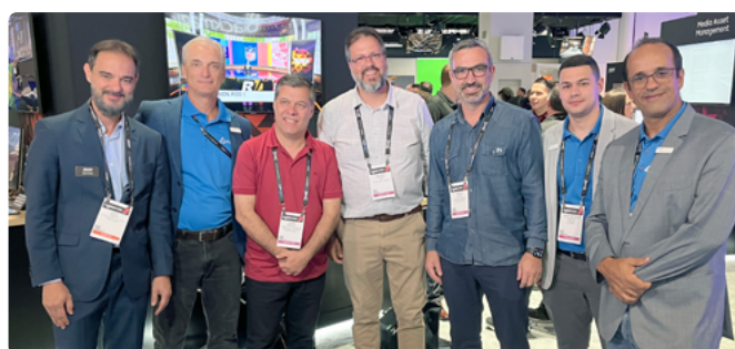
Equipe da Novo Tempo com executivos da Alliance no estande da Ross Video