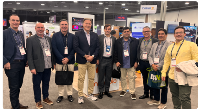
Delegação da Vivensis e a Rede Amazônica se encontram no Pavilhão Brasileiro.