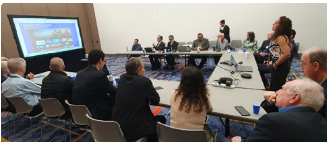
Encontro Brasil e Japão na sala da SET com o objetivo de avançar sobre DTV+.