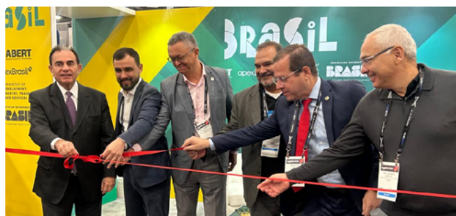
Executivos de entidades e governo brasileiro inauguram o estande da ABERT na NAB Show 2025.