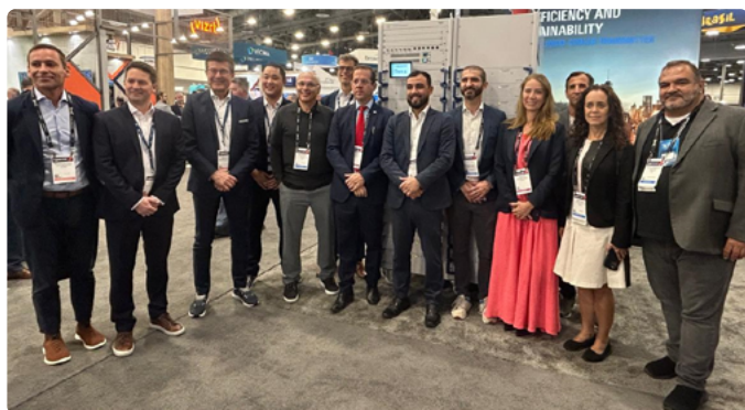
Delegação Brasileira durante a visita ao estande da Rohde & Schwarz onde conversaram sobre novos transmissores de DTV+.