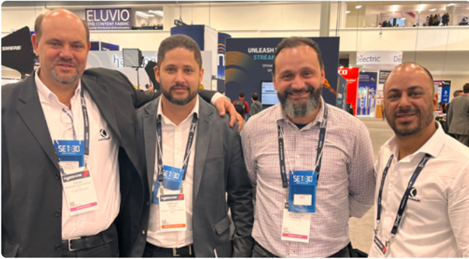
Equipe da TV Integração na NAB Show 2025