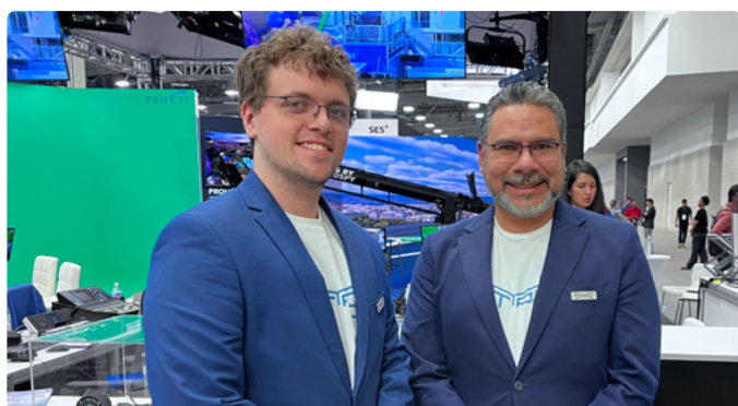
Equipe da stYpe para o Brasil adiantou novidades em realidade virtual aumentada