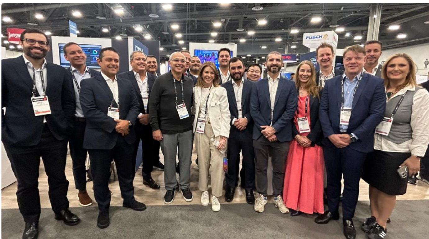
Delegação Brasileira com membros do governo federal, emissoras, AESP, Fórum SBTVD, entre outros visitam o Pavilhão Brasil onde empresas demonstram diferentes soluções para DTV+.