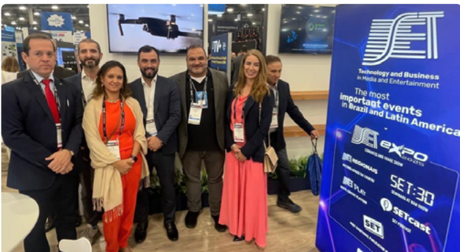
Delegação do governo brasileiro visita estande da SET no Pavilhão Brasileiro durante a NAB Show 2025.