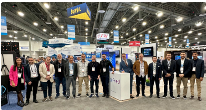
Executivos que demonstraram a tecnologia brasileira na NAB Show 2025

Como a reportagem tinha previsto na edição anterior, após vários anos de ausência, o Pavilhão Brasil esteve muito movimentado pelas novidades e expectativas relativas à implantação da DTV+ no país. Na manhã do primeiro dia da NAB 2025, como explicado na matéria sobre o SET:30, o presidente do Fórum SBTVD apresentou o primeiro kit de recepção, o que acelerou ainda mais a procura por soluções.