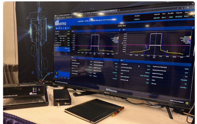
Receptor e analisador AVQ1030 de RF para MIMO da Avateq

e Múltiplas Saídas) é ser nativo e permite analisar sinais MIMO, uma solução que já foi testada nos laboratórios da Avateq, em Toronto, Canadá em colaboração com a Enensys Technologies “no desenvolvimento e teste de uma cadeia completa de transmissão e recepção ponta a ponta baseada no padrão DTV+. Este teste de interoperabilidade envolveu o conjunto avançado de transmissão da Enensys e nosso receptor e analisador MIMO AVQ1030 atualizado. Juntos, validamos a implementação de todas as principais configurações DTV+, incluindo os modos MIMO LDM”.