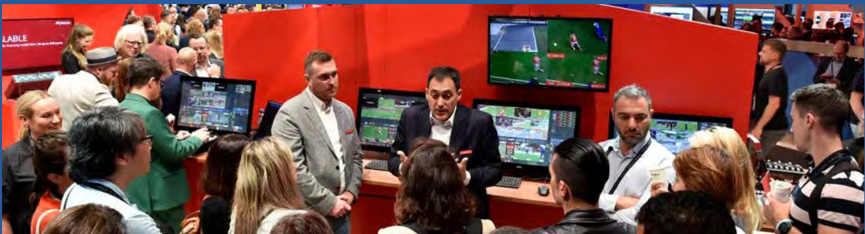
Riedel apresentou no IBC 2023 a plataforma MediorNet HorizoN, uma solução de processamento híbrido que segundo os seus executivos "rompe a fronteira entre SDI e IP", porque sua infraestrutura baseada em SDI e SMPTE ST 2110 com uma matriz densa de gateways UHD, oferece até 128 gateways SDI - IP, até 32 canais de conversão SDR-HDR e correção de cores, ou até 16 conversões up/down/cross e correções de cores.