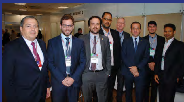
SET, Anatel e Ancine reunidas no SET EXPO