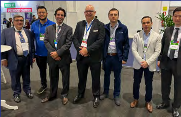
Equipe de Ucan/LiveU no SET EXPO / Foto: Fernando Moura