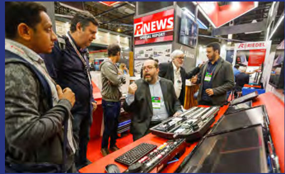
Ross Video apresentou soluções de produção