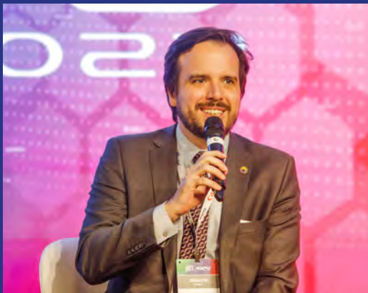
Na Abertura do SET EXPO, o Presidente da Anatel, Carlos Baigorri disse que o Programa Digitaliza Brasil é fundamental como política pública