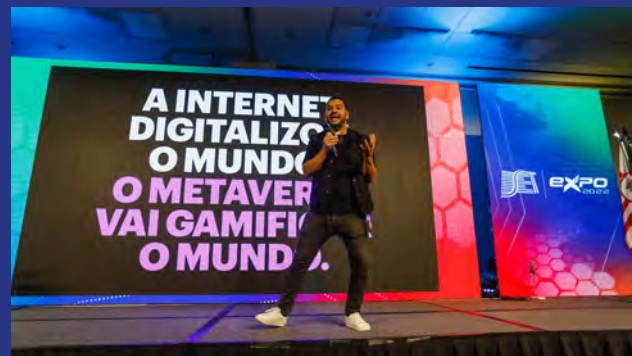
Eco Moliterno, CCO da Accenture Interactive para a América Latina, disse na abertura do SET EXPO que a Internet digitalizou o mundo e o metaverso vai gamifica-lo