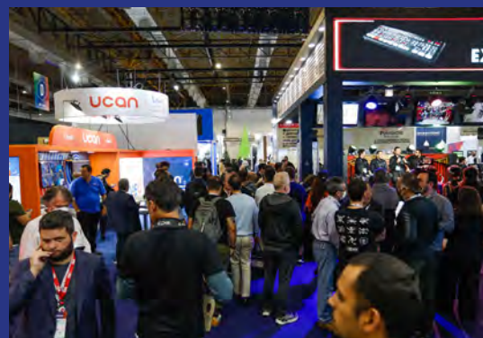
Mais 14 mil visitantes percorreram, durante os três dias exposição, os estandes do SET EXPO 2022