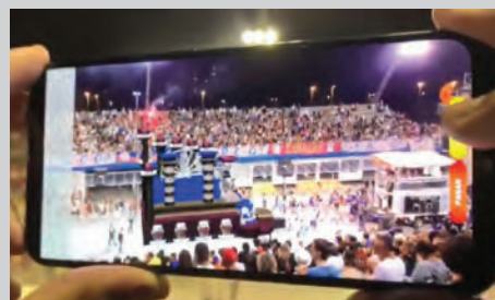
Experiência de uso do Carro 6 na Avenida Digital

saltar que a UFABC também produziu um braço biônico, com impressão 3D, que foi doado e utilizado por um componente que desfilou na Ala Social da escola. ■