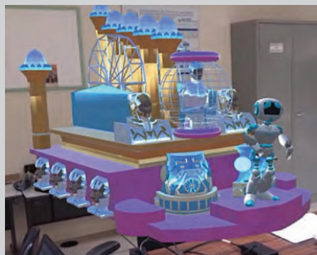
Carro alegórico em realidade aumentada

Dentre os robôs presentes nos carros alegóricos, estavam: um conjunto de braços robóticos colaborativos produzidos pela empresa dinamarquesa Universal Robots, os “Robôs Alegria”, que demonstravam emoções trazidas pelo som da bateria, através de coreografias de luzes e movimentos; um conjunto de braços robóticos da empresa francesa Staubli, sincronizados pelo membro da Escola que estava em destaque no carro alegórico; e um conjunto de braços robóticos produzidos pela empresa suíça de automação ABB. Yumi, como foi chamado, distribuía baquetas aos integrantes ritmistas da bateria e era capaz de imitar movimentos de pessoas que interagiam com ele, através de sensores. Vale res-