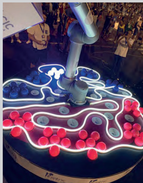
À esquerda, mão biônica da UFABC no desfile, em cima, braço robótico Yumi, em performance com a presidenta da Rosas de Ouro na quadra da Escola; e em cima à direita, os Robôs Alegria na Avenida